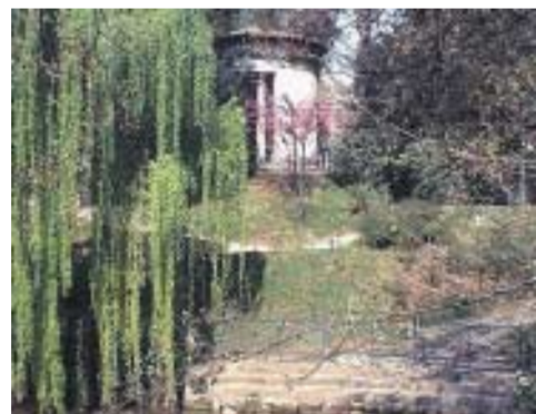
Giardini Treves. Tempio dello Jappelli (1783-1852).

Arte, teatro, musica, spettacolo, poesia, cabaret quest'anno alla rassegna padovana Notturmi d'Arte. Alla XVII edizione, l'iniziativa si propone fedele alla sua linea originale di valorizzazione del patrimonio culturale e artistico di Padova, ma si prospetta anche sempre più innovativa.