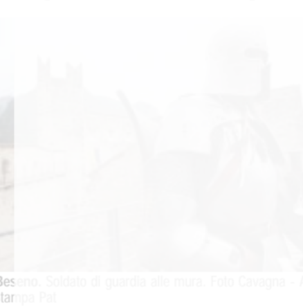
Castel Beseno. Soldato di guardia alle mura.

Un'occasione per ammirare una raccolta di figurini storici d'eccezione è data dall'esposizione "Piccoli eserciti: soldati in miniatura", a Castel Beseno, nei pressi di Besenello (Trento), fino al 14 settembre. Fanno bella mostra di sé, in una sala al primo piano del castello, 100 miniature in scala, di dimensioni comprese tra 6 e 15 centimetri, che riproducono con rigore scientifico i soldati e le loro dotazioni belliche durante il periodo medioevale.